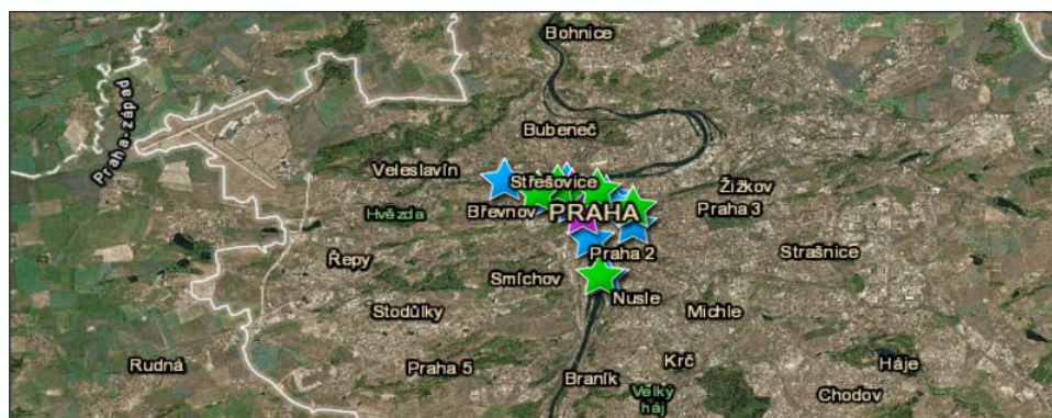
Εικόνα 4. Στιγμιότυπο ψηφιακής χαρογράφησης μνημείων Τσεχίας.