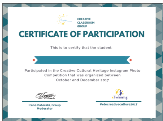
Εικόνα 1. Βεβαίωση συμμετοχής και διάκρισης ευρωπαϊκού διαγωνισμού

Αποτελέσματα της δραστηριότητας: Σύνδεση χαρακτηριστικών της πολιτιστικής ταυτότητας και της κουλτούρας των ανθρώπων σε σχέση με τον τόπο διαμονής τους και τον τρόπο ζωής τους. Καταγραφή ομοιοτήτων και διαφορών που σχετίζονται με την αρχιτεκτονική, τον τρόπο ζωής και άλλα. Συμμετοχή και διάκριση στον ευρωπαϊκό διαγωνισμό μέσω πλατφόρμας κοινωνικής δικτύωσης (e-twinning) Εικόνα 1.