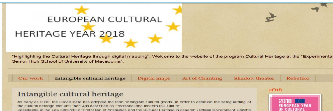
Εικόνα 9. Στιγμιότυπο από το ιστολόγιο