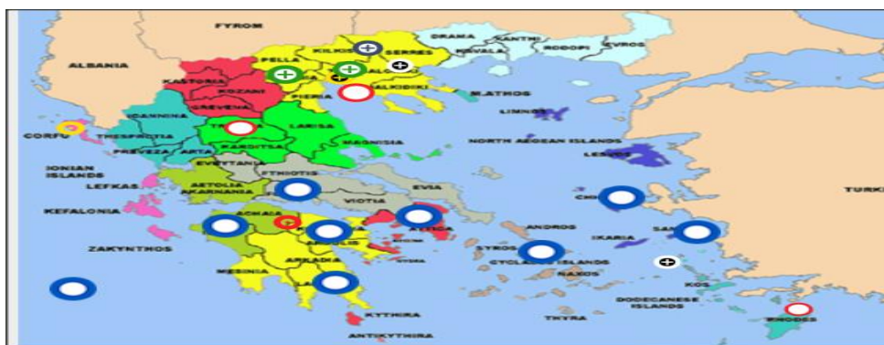
Εικόνα 6. Διαδραστική αφίσα (λογισμικό Thinglink) με θρησκευτικά μνημεία στην Ελλάδα