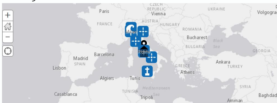
Εικόνα 3. Στιγμιότυπο ψηφιακής χαρογράφησης μνημείων Ιταλίας