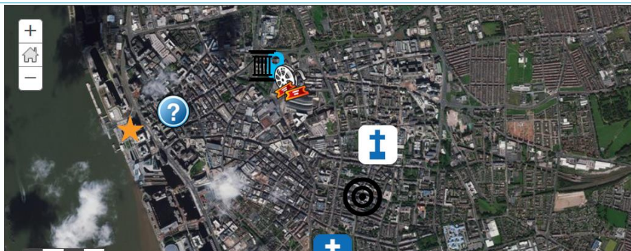
Εικόνα 2. Στιγμιότυπο ψηφιακής χαρογράφησης μνημείων Αγγλίας