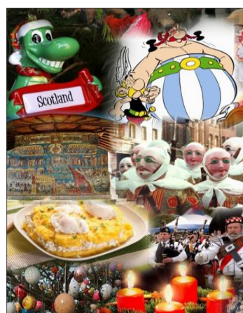
Εικόνες 7 & 8. Πόστερ από την παρουσίαση στο Συνέδριο e- twinning.