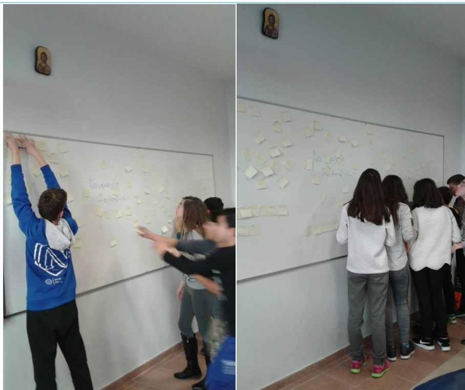
Εικόνες 3- 4 Ομαδικές δραστηριότητες

Υπήρξε όμως μια δυσκολία στη διαχείριση του χρόνου, αφού, όπως φάνηκε δεν μας εξασφάλιζε άνεση κινήσεων. Θα μπορούσαμε να είχαμε χωρίσει τους μαθητές σε περισσότερες ομάδες ώστε να είναι ολιγομελείς και να συνεργάζονται καλύτερα. Αυτό βέβαια προϋπέθετε περισσότερο χρόνο για την παρουσίαση του Αγώνα λόγων. Αξίζει, βέβαια, κάποια στιγμή να το δοκιμάσουμε.