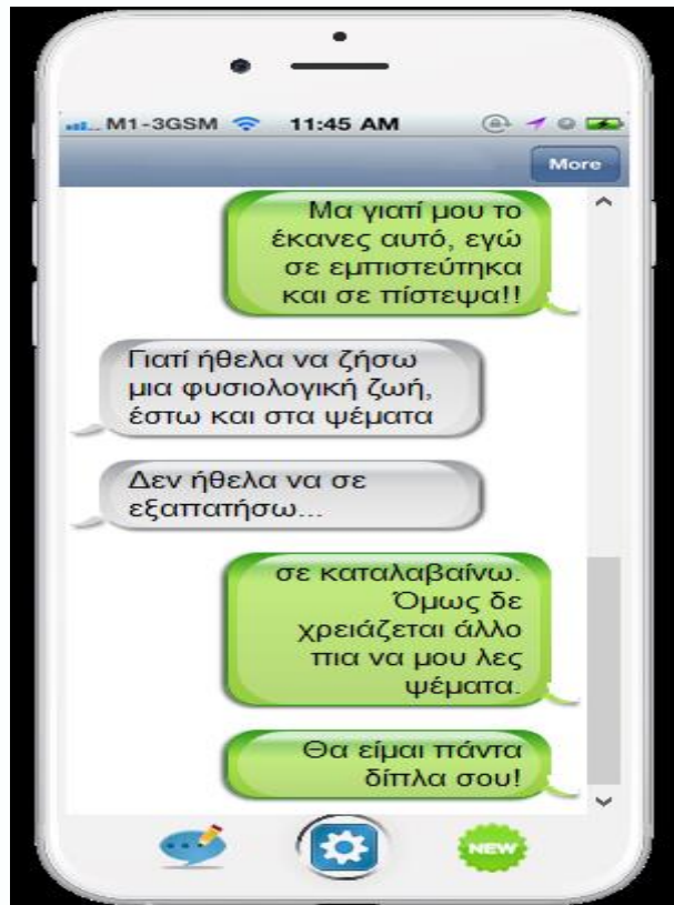
Εικόνα 3: Διάλογος στο κινητό τηλέφωνο

Αποτελέσματα της δραστηριότητας: Οι μαθητές συμμετείχαν σε μια διαδικασία ολοκληρωμένη και είχαν τη χαρά να παρουσιάσουν οι ίδιοι τις εργασίες τους στους συμμαθητές τους. Δικαιολόγησαν τις επιλογές τους και απάντησαν στα ερωτήματα που τέθηκαν. Τέλος είδαν τις εργασίες τους να αναρτώνται τόσο στην ιστοσελίδα του σχολείου όσο και στο ιστολόγιο της εκπαιδευτικού, κάτι που αποτελεί μεγάλη επιβράβευση για την προσπάθειά τους.