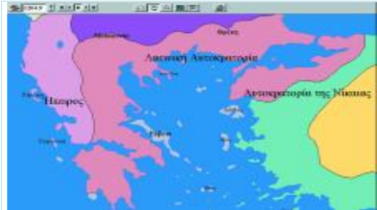
Εικόνα 2: Το περιβάλλον εργασίας του λογισμικού «Ιστορικός Άτλαντας Centennia»

Ταυτόχρονα πληκτρολόγησαν στο «Ιστορικός Άτλαντας Centennia» τη χρονολογία 1204, (Εικόνα 2) όπου εμφανίζονται οι εδαφικές διαφοροποιήσεις που επέφερε η λατινική κυριαρχία και αναλόγως των ζητούμενων προχώρησαν και στις υπόλοιπες χρονολογίες.