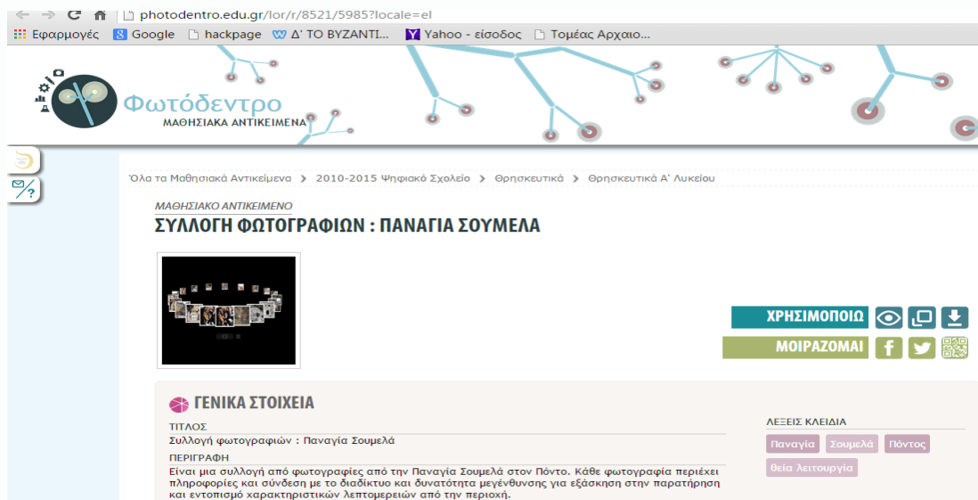
Εικόνα 4: Το περιβάλλον του Μαθησιακού Αντικειμένου: Παναγία Σουμελά http://photodentro.edu.gr/lor/r/8521/5985?locale=el

2. Να αναζητήσετε στη διεύθυνση http://photodentro.edu.gr/lor/r/8521/5985?locale=el ( Συλλογή φωτογραφιών: Παναγία Σουμελά) σχετικό οπτικό υλικό (Εικόνα 4) και να παρουσιάσετε 5-6 διαφάνειες με ένα σύντομο υπομνηματισμό για το σύμβολο του Ποντιακού Ελληνισμού.