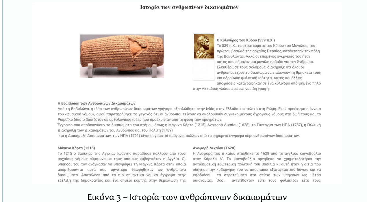
Εικόνα 3 – Ιστορία των ανθρωπίνων δικαιωμάτων