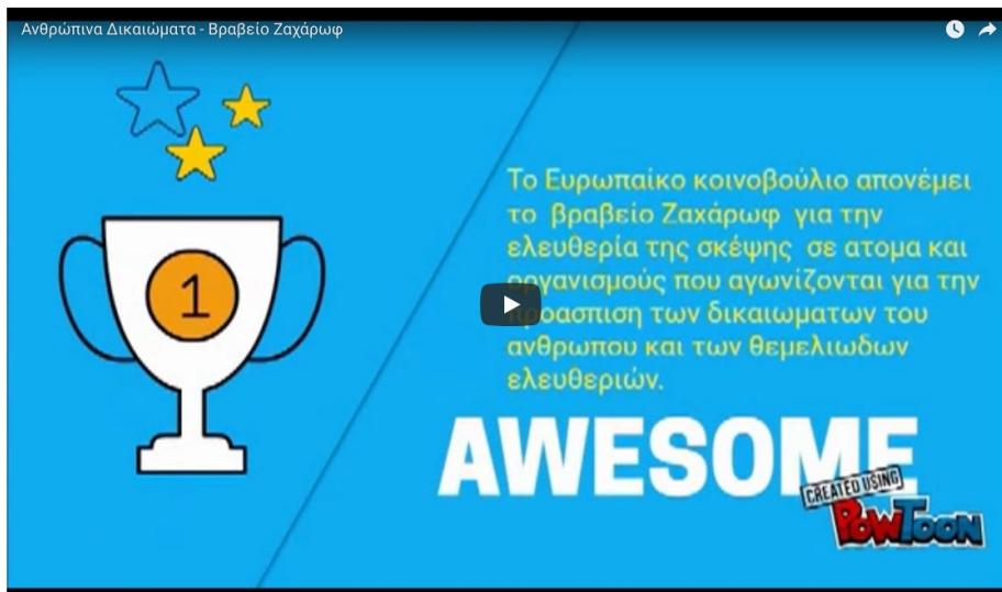
Εικόνα 4 – Από την παρουσίαση για το Βραβείο Ζαχάρωφ

Το Ευρωπαϊκό Κοινοβούλιο στηρίζει τα ανθρώπινα δικαιώματα μέσω της ετήσιας απονομής του θεσπισθέντος το 1988 βραβείου Ζαχάρωφ για την ελευθερία της σκέψης. Το βραβείο απονέμεται σε πρόσωπα με εξέχουσα συμβολή στον ανά τον κόσμο αγώνα για τα ανθρώπινα δικαιώματα, εφιστώντας την προσοχή όλων στις παραβιάσεις των ανθρωπίνων δικαιωμάτων καθώς και στηρίζοντας τους βραβευθέντες και τον σκοπό τους.