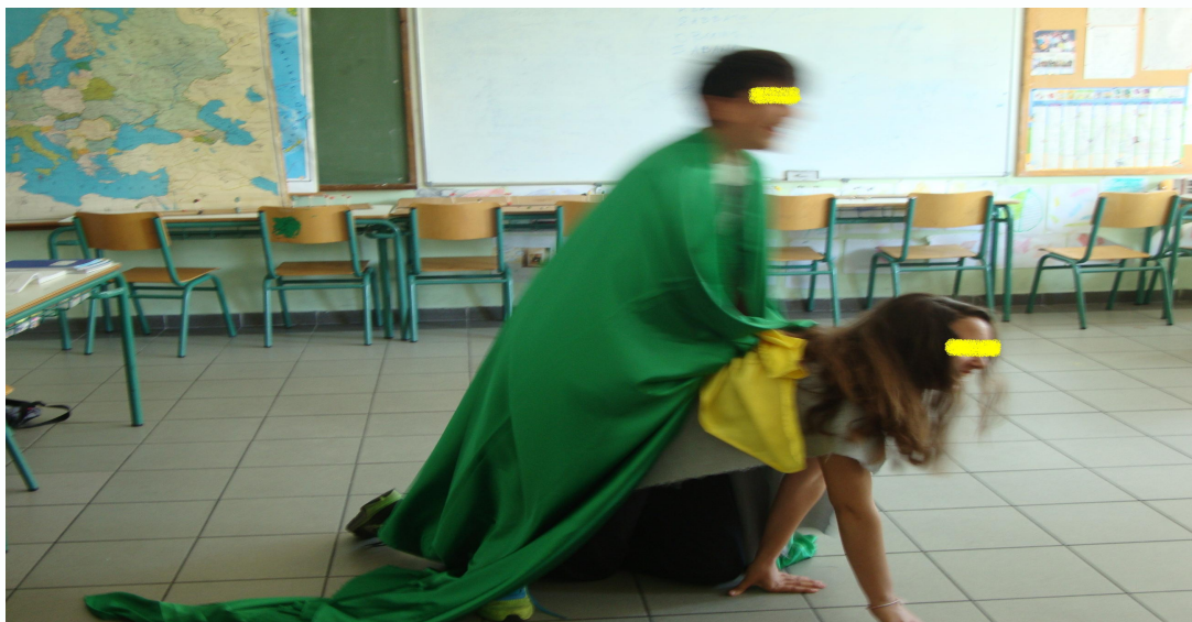
Εικόνα 4 – «Η αρπαγή της Ευρώπης» από τους Θαλασσοπόρους του Ταύρου (β)