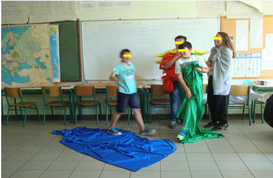
Εικόνα 3 – «Η αρπαγή της Ευρώπης» από τους Θαλασσοπόρους του Ταύρου (α)