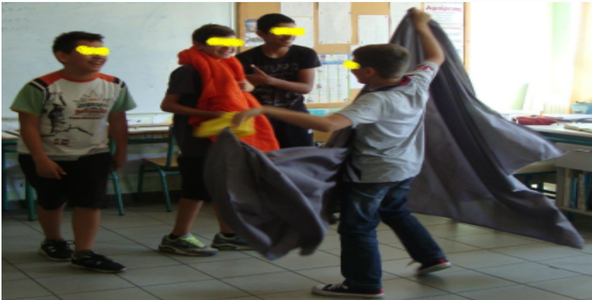
Εικόνα 2 – «Η αρπαγή της Ευρώπης» από τους Ατρόμητους Εξερευνητές