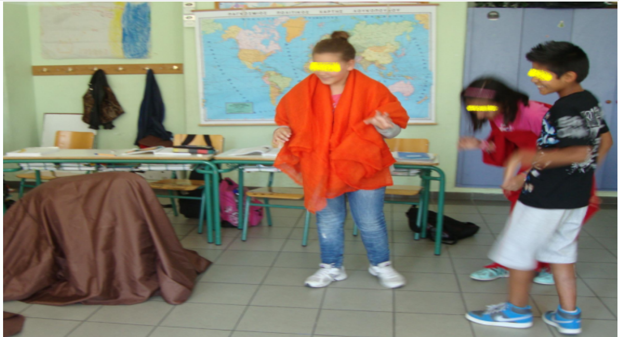
Εικόνα 1 – «Η αρπαγή της Ευρώπης» από τους Φοβερούς Γεωγράφους