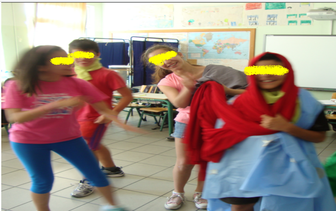
Εικόνα 5 – «Η αρπαγή της Ευρώπης» από τα Ταξιδιάρικα Παιδιά

Αποτελέσματα της δραστηριότητας: Τα παιδιά διασκέδασαν με τη δραστηριότητα αυτή, παρακολούθησαν με το ίδιο κέφι τις παρουσιάσεις όλων των ομάδων και δεν ήθελαν να βγουν διάλειμμα, όταν ολοκληρώθηκε η δραστηριότητα. Ευτυχώς, η ανάληψη γυναικείων ρόλων από τα αγόρια δεν αποτέλεσε αντικείμενο κοροϊδίας, κάτι που φοβόμουν. Τα παιδιά φαίνεται να διαμορφώνουν θετική στάση απέναντι στην εκπαιδευτική πρακτική και αναμένουν τη συνέχισή της.