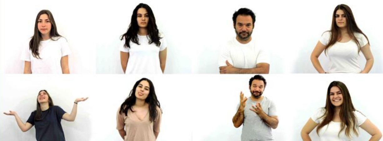
Εικόνα 6: Το μαθητικό φωτογραφικό έργο 'b3_yours3lf' (be yourself)