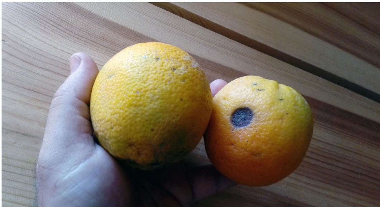
Εικόνα 4: Εγώ, το πορτοκάλι

Πρόκειται για απόσπασμα και διασκευή της δραστηριότητας 'Λεμόνια' (βλέπε πηγές). Τα παιδιά κάθισαν σε κύκλο και τους μοιράστηκε από ένα πορτοκάλι. Τους ζητήθηκε να το περιεργαστούν, να το παρατηρήσουν λεπτομερώς για λίγο. Έπειτα, να μιλήσουν για τα χαρακτηριστικά του, τα στοιχεία που δείχνουν την μοναδικότητά του, τις όποιες ιδιομορφίες αλλά και, αργότερα, τις ομοιότητες του με τα πορτοκάλια των άλλων.