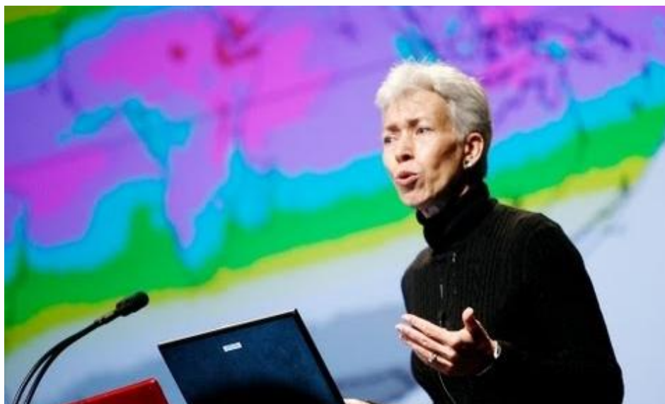
Εικόνα 1: Στιγμιότυπο από την ομιλία της Nina Jablonski στο TEDx για την εξέλιξη του χρώματος του δέρματος στον άνθρωπο

Ωστόσο η έννοια της προσαρμογής επεκτάθηκε άμεσα στην ερμηνεία του ‘μόνιμου’ ‘φυλετικού’ χρώματος. Με αφόρμηση ένα δημοσίευμα (Οι πρώτοι Ευρωπαίοι ήταν μαύροι) τέθηκε το ερώτημα περί της εξέλιξης του χρώματος του δέρματος στο είδος μας . Η μαθητική ομάδα προσέγγισε διερευνητικά το ερώτημα αξιοποιώντας την προηγούμενη προσέγγιση περι δράσης της υπεριώδους ακτινοβολίας και κατέληξε στην εύστοχη υπόθεση ότι ανάλογα με τα περιβαλλοντικά χαρακτηριστικά του τόπου (πρωτίστως ο μέσος δείκτης UV) η μελανίνη είναι αντιστοίχα απαραίτητη. Δεν παρέλειψε να συμπεριλάβει στο σύστημα σκέψης και την ανάμιξη γενετικού υλικού κατά τη συνεύρεση ατόμων διαφορετικού χρώματος. Στη συνέχεια, προς επικύρωση της υπόθεσής τους, παρακολούθησαν μια βιντεοσκοπημένη ομιλία TEDx της γνωστής ανθρωπολόγου - παλαιοβιολόγου Nina Jablonski που συνόψιζε την εξέλιξη του χρώματος του ανθρώπινου δέρματος αναφερόμενη στη γενετική ποικιλότητα, τη φυσική επιλογή και τη μετακίνηση παλαιών πληθυσμών του Homo sapiens από την Αφρική στην Ευρώπη κλπ.