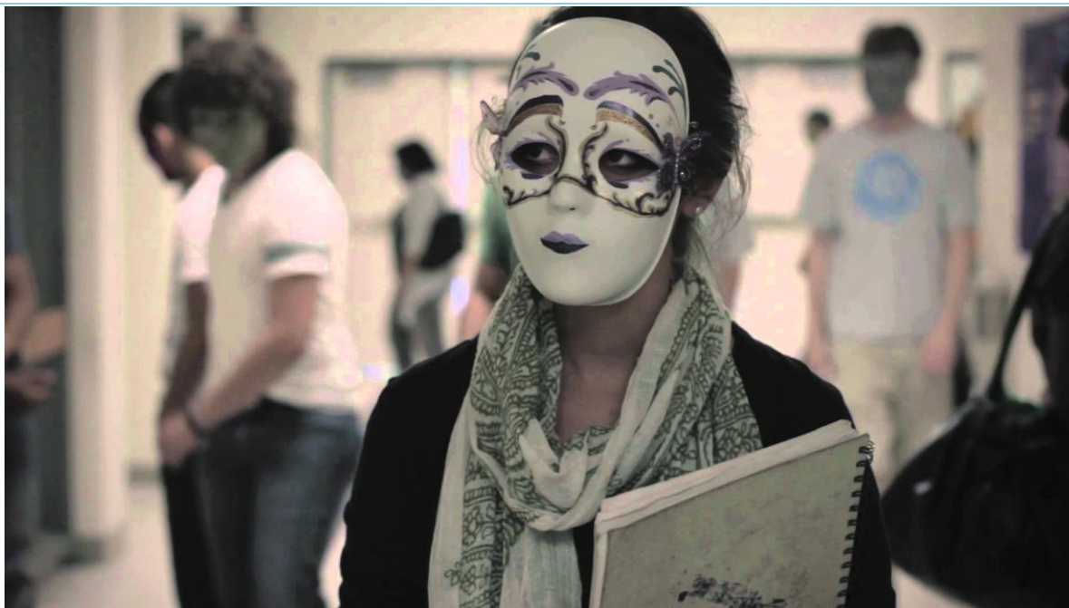
Εικόνα 5: Στιγμιότυπο από την ταινία μικρού μήκους 'Identity'

ΔΡΑΣΤΗΡΙΟΤΗΤΑ 5: Δημιουργία τεχνήματος: Το φωτογραφικό έργο 'b3_yourslf' (be yourself)