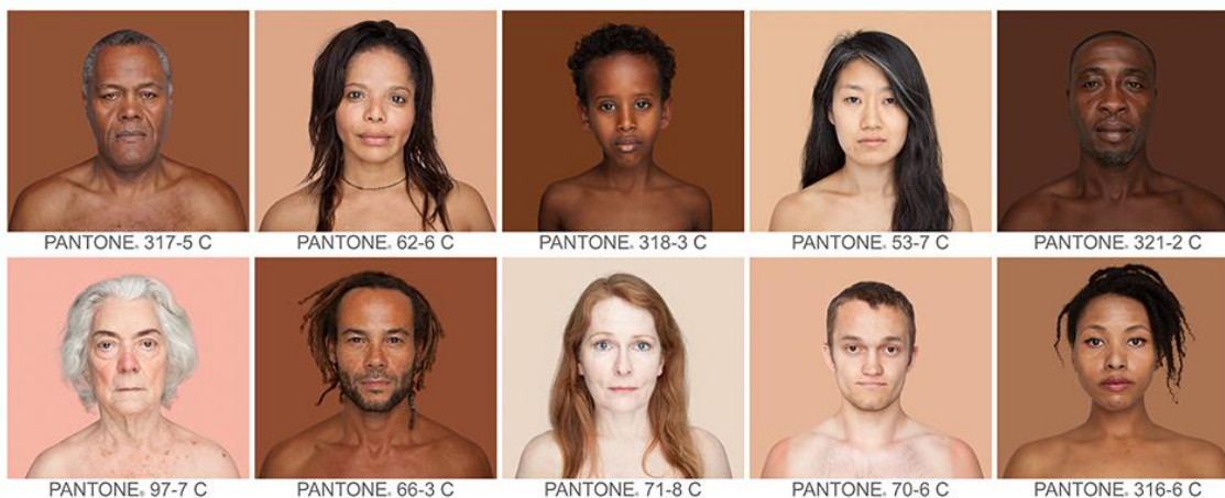
Εικόνα 3 – Δείγμα από το έργο Humanae 1

Στο στάδιο αυτό προσεγγίστηκε καλλιτεχνικά το χρώμα του δέρματος δημιουργώντας ένα νοητικό τρίγωνο με τα προηγούμενα βήματα. Αξιοποιήθηκε το έργο της φωτογράφου Angelica Dass με τίτλο ‘Humanae’ , δείγμα του οποίου παρατίθεται στην εικόνα 3, κατόπιν παραχώρησης (απαραίτητη η επισκόπηση όρων πνευματικής ιδιοκτησίας στο www.angelicadass.com )