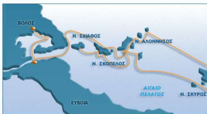
Πραγματικά δρομολόγια ακτοπλοϊκών συγκοινωνιών