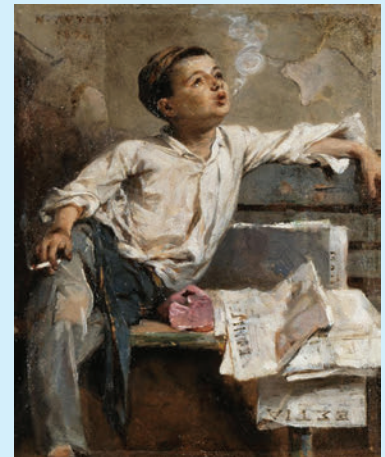
Νικηφόρος Λύτρας, Παιδί που καπνίζει, 1894.