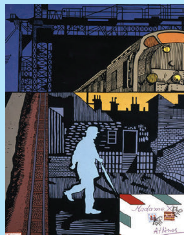
Γιώργος Ιωάννου, Περί ενός συμβάντος.

«Η παρεκκλίνουσα συμπεριφορά είναι παράβαση κανόνα συμπεριφοράς που ορισμένη κοινωνική ομάδα θεωρεί ως τηρητέο από τα μέλη της, παράβαση που προκαλεί αντιδράσεις αποδοκιμασίας.» (Α. Γιωτοπούλου-Μαραγκοπούλου, Εγχειρίδιο Εγκληματολογίας , Αθήνα 1984)