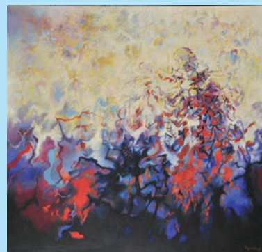
Απόστολος Κιλεσσόπουλος, Αλλημιστής , αρ. 2, 1989.

2. Ο όρος πράξεις στις διατάξεις των ποινικών νόμων περιλαμβάνει και τις παραλείψεις.