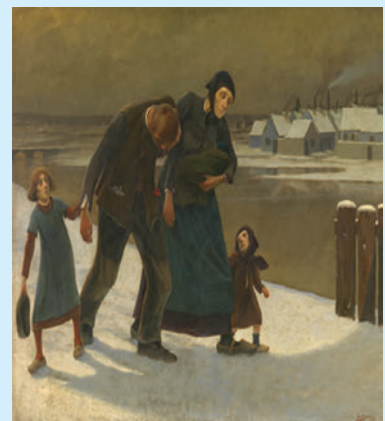
Ευγένιος Λέεμανς, Ο μέθυσος, 1898.