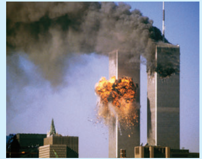
Η τρομοκρατική επίθεση στις ΗΠΑ, στο παγκόσμιο κέντρο εμπορίου.

Οι επιπτώσεις της τρομοκρατίας είναι ανάλογες με τις δραστηριότητές της. Αεροπειρατίες, βομβιστικές ενέργειες, καταλήψεις δημοσίων κτηρίων, δολοφονίες, απαγωγές κτλ. είναι μερικές από τις δραστηριότητες των τρομοκρατών. Οι επιπτώσεις αυτών των δραστηριοτήτων είναι πολλές: απώλειες ανθρώπων, σωματικά και ψυχικά τραύματα, υλικές καταστροφές, οικονομική ύφεση κτλ. Επιπλέον, τα κράτη αντιμετωπίζουν πρόβλημα ασφάλειας και ορισμένα περιορίζουν τα δικαιώματα των πολιτών εν ονόματι της τρομοκρατίας. Από την άλλη μεριά οι πολίτες κυριαρχούνται από τον φόβο της τρομοκρατίας.