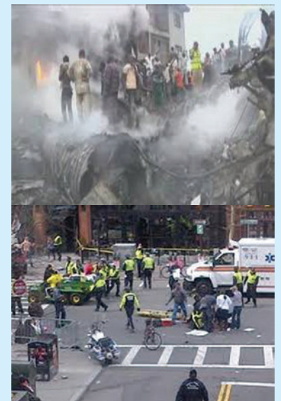
Τα αποτελέσματα της τρομοκρατίας.

Πώς αντιμετωπίζεται η τρομοκρατία; Οι Η.Π.Α. μετά την 11η Σεπτεμβρίου 2001 έχουν κηρύξει τον πόλεμο στην τρομοκρατία (π.χ. Αφγανιστάν). Οι πιο ψύχραιμοι προτείνουν τη διεθνή συνεργασία, με διπλωματικά και αστυνομικά μέσα, αλλά και την αντιμετώπιση των αιτιών που γεννούν την τρομοκρατία.