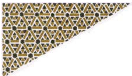
Εικόνα 1: Βυζαντικό μωσαϊκό

5) Μπορείς να ζωγραφίσεις στο παρακάτω πλαίσιο ένα επαναλαμβανόμενο ψηφοθέτημα;