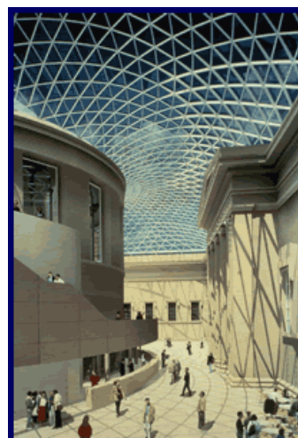
Εικόνα 2: Τμήμα του στεγάστρου που σκεπάζει την αυλή του Βρετανικού Μουσείου.

6) Ποιο γεωμετρικό σχήμα αποτελεί τη βασική επαναλαμβανόμενη ψηφίδα στις παραπάνω εικόνες;