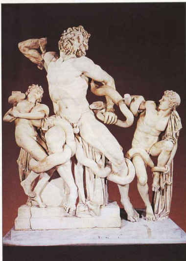
6. Από ρωμαϊκό παραλλαγμένο αντίγραφο γνωρίζουμε το σύμπλεγμα του Λαοκόοντα, το οποίο έχει επηρεάσει τους καλλιτέχνες από την Αναγέννηση και μετά.

στη Ρόδο. Από τα έργα του, το μόνο που διασώθηκε είναι το έπος του «Αργοναυτικά». Επίσης Ξένος, ο φιλόσοφος Αρίστιππος ο Κυρηνάιος, μαθητής του Σωκράτη, είχε εγκατασταθεί στη Ρόδο. Ρόδιος όμως ήταν ο Εύδημος, μαθητής του Αριστοτέλη, ο οποίος εισήγαγε στη Ρόδο την περιπατητική φιλοσοφία και ξεχώρισε και ως μαθηματικός. Και για τον Αθηναίο ρήτορα Αισχίνη, λένε πως εγκαταστάθηκε στη Ρόδο και ίδρυσε σχολή ρητορικής. Αργότερα, τον 2ο αιώνα π.Χ., όταν η Ρόδος βρίσκεται στη μεγάλη της οικονομική άνθηση, η πολιτισμική της ζωή προοδεύει παράλληλα: γίνεται κέντρο εράμματος της Αθήνας, όπου πολλοί, κυρίως Ξένοι, πηγαίνουν να