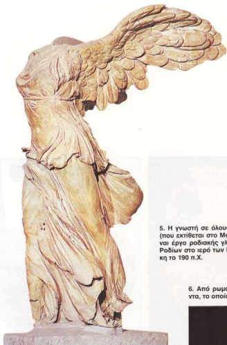
5. Η γνωστή σε όλους Νίκη της Σαμοθράκης (που εκτίθεται στο Μουσείο του Λούβρου) είναι έργο ροδιακής γλυπτικής, αφιέρωμα των Ροδίων στο ιερό των Καβειρών στη Σαμοθράκη το 190 π.Χ.

του ελληνικού πνεύματος, θα αναφέρουμε εδώ μερικά ονόματα προσωπικοτήτων που έζησαν στη Ρόδο, πλουτίζοντας τις γνώσεις και προάγοντας τις επιστήμες, είτε αυτοί ήσαν Ρόδιοι, είτε έζησαν για πολλά χρόνια στο νησί.