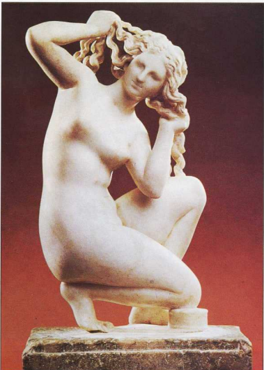
7. Η Λούαυμένη Αφροδίτη, γλυπτό του 1ου αι. π.Χ. Πρόκειται για το σωζόμενο αντίγραφο του έργου του Βήθνου γλύπτη Διοδόλου.