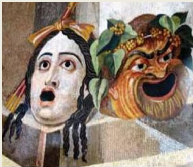
0. «Οι μάσκες της τραγωδίας και της κωμωδίας», ψηφιδωτό από θριανού στο Τίβολι κοντά στη Ρώμη, 2ος αι.