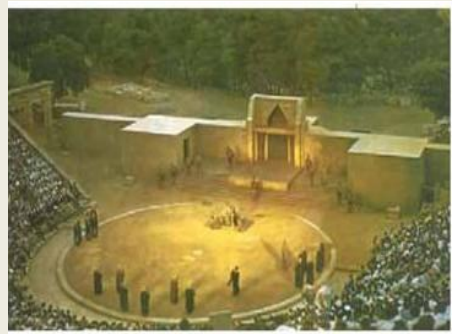
3. Παράσταση στο αρχαίο θέατρο της Επιδαύρου.