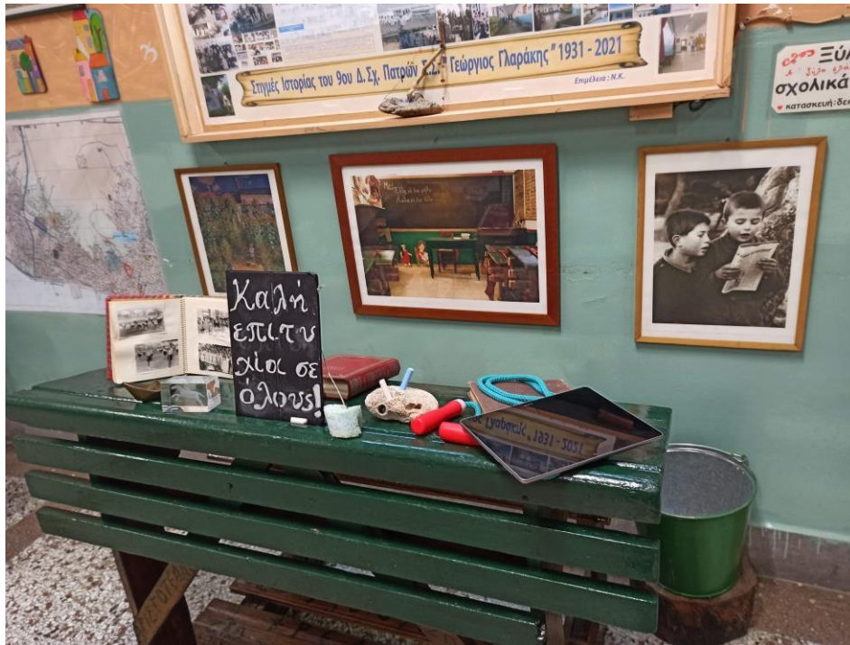
Ιούνιος 2022 Είσοδος 9ου Δημοτικού Σχολείου Πατρών "Γεώργιος Γλαράκης"