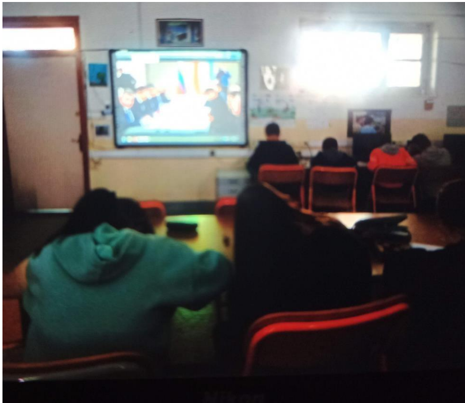
28-2-2022 , 12.00 , Αίθουσα Πληροφορικής 9ου Δημοτικού Σχολείου Πατρών "Γώργιος Γλαράκης"