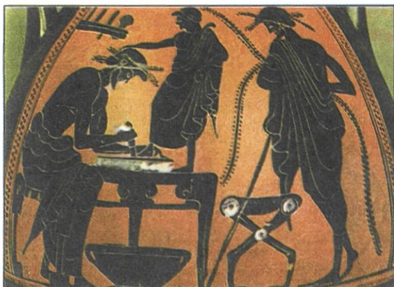
Παράσταση από αγγείο (Μουσείο Ashmolean Οξφόρδης). Εικονίζεται υποδηματοποιός να παίρνει μέτρα ενός αγοριού για να κατασκευάσει υποδήματα.