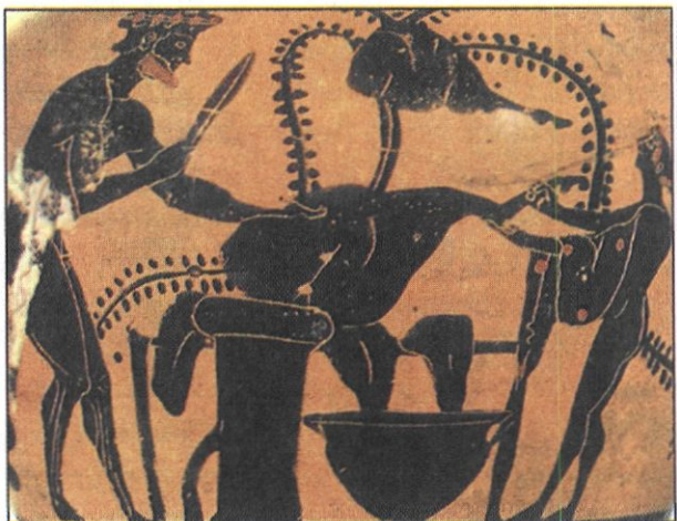
Σκηνή κροεοπωλείου από οinoχόη (6ος αι. π.Χ., Μουσείο καλών τεχνών Βοστώνης). Εικονίζεται κροεπώλης να τεμαχίζει κρέας.

Στην Αθήνα, στην περιοχή του Κεραμικού, έστηναν τα περίφημα εργαστήριά τους οι αγγειοπλάστες , οι οποίοι κατασκεύαζαν πιθάρια, ποτήρια (κύλικες), αγγεία σε διάφορα σχήματα, λυχνάρια κ.ά. Ο τροχός που αποτελούσε το κύριο εργαλείο τους ήταν απλός: ένας δίσκος πάνω σε έναν κάθετο άξονα. Στο δίσκο αυτό τοποθετούσε ο τεχνίτης τον πηλό και τον γύριζε με το χέρι. Όταν τέλειωνε το αγγείο, το ξέραιναν στον ήλιο ή το έψηναν σε φούρνο και άρχιζαν τη διαδικασία της διακόσμησης. Οι αγγειογράφοι συνήθως ακολουθούσαν τον ερυθρόμορφο ή μελανόμορφο ρυθμό, προσθέτοντας πολλές φορές και άλλα χρώματα. Τα περισσότερα αγγεία που κατασκεύαζαν εξυπηρετούσαν καθαρά πρακτικούς σκοπούς. Τα λίγα που είχαν διακοσμητικό χαρακτήρα αποτελούσαν το καύχημα των εργαστηρίων. Σ' αυτά συνήθως υπέγραφαν από κοινού αγγειοπλάστης και αγγειογράφος ή ένας από τους δύο.