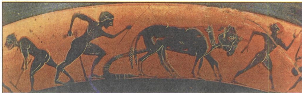
Παράσταση από αρχαϊκή κύλικα (Μουσείο Λούβρου). Το όργωμα και οι άλλες αγροτικές εργασίες αποτελούσαν την κύρια μέριμνα των Ελλήνων κατά την αρχαιότητα.