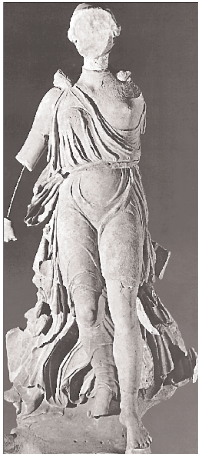
Η Νίκη του Παιωνίου (420 π.Χ.), ανάθημα των Μεσσηνίων και των Ναυπακτίων στην Ολυμπία. Η θεά με ανοιγμένα τα φτερά και με απλωμένο το ιμάτιο έρχεται πετώντας από τον ουρανό προς τη γη. (Ολυμπία, Αρχαιολογικό Μουσείο). (Οι φωτογραφίες του κειμένου είναι από το έργο «Οι Ολυμπιακοί Αγώνες την Αρχαία Ελλάδα» εκδ. «Εκδοτική Αθηνών», 1976).

Ελλάδα στη Ρώμη, οι κατακτητές και προπάντων οι αξιωματούχοι και οι αυτοκράτορες που είχαν ελληνική παιδεία και πίστευαν ότι η καταγωγή τους ήταν κοινή με των Ελλήνων, παίρνουν συχνά μέρος στους αγώνες της Ολυμπίας. Όταν μάλιστα το 212 μ.Χ. ο Καρακάλλας παρέχει το δικαίωμα του Ρωμαίου πολίτη σε όλους τους κατοίκους του απέραντου ρωμαϊκού κράτους, αποκτούν πλέον όλοι το δικαίωμα να διαγωνίζονται στην Ολυμπία. Εκτοτε στους καταλόγους των Ολυμπιονικών εμφανίζονται συχνά και Αιγύπτιοι, Ισπανοί, Σύριοι, Καπαδόκες, Αρμένιοι κ.α. Οι Ολυμπιακοί Αγώνες έχουν γίνει πια οικουμενικοί.