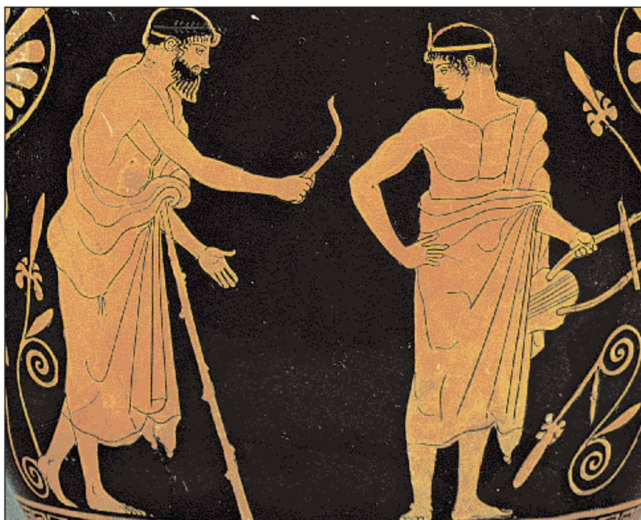
Γυμναστής καλωσορίζει και δίνει τη σπλεγγίδα σε έφηβο που μόλις επέστρεψε από το μάθημα της μουσικής κρατώντας ακόμα τη λύρα του. Παράσταση από ερυθρόμορφο σκύφο (540 π.Χ.) όπου φαίνεται καθαρά ο συνδυασμός της μουσικής παιδείας με τη γυμνική. (Berkeley, Lowie Museum of Anthropology).