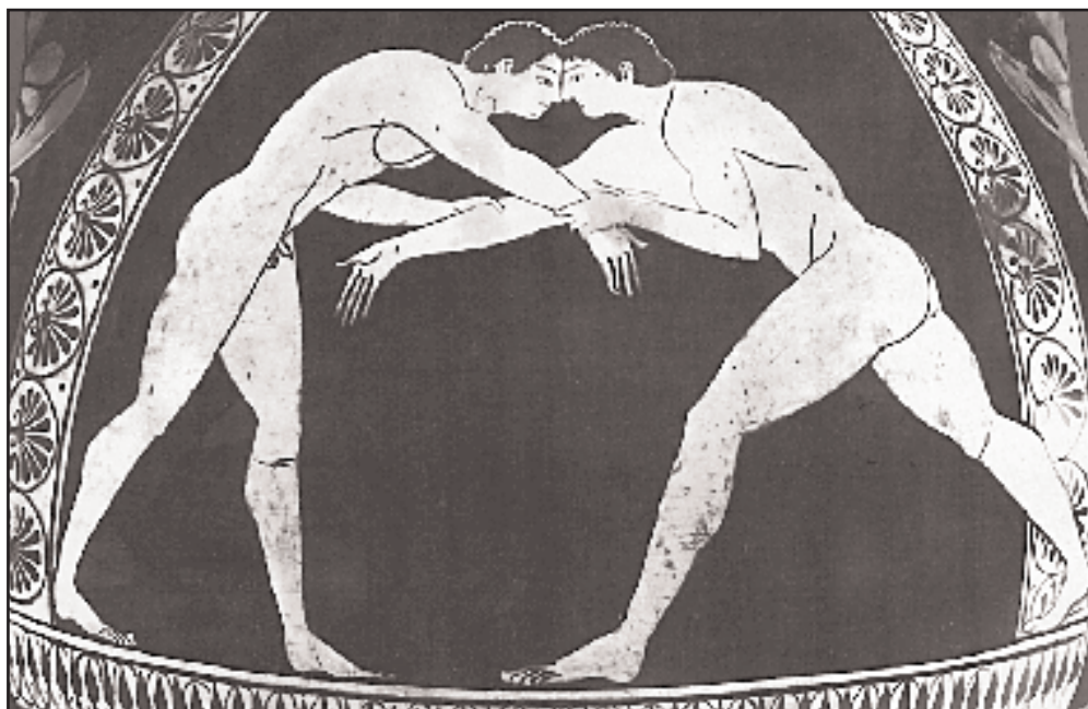
Εναρξη αγώνα πάλης. Οι παλαιστές εφαρμόζουν μια από τις αρχικές λαβές. Παράσταση από αμφορέα, τέλους 6ου αι. π.Χ. (Λένινγκραντ, Ερμιτάζ).

γλώσσα, θρησκεία και τρόπος ζωής, ίδια ιδανικά—ήταν πολύ περισσότερα από τις διαφορές που τους χώριζαν. Και στην Ολυμπία ήταν όπου χαλκεύθηκε, περισσότερο από κάθε άλλο κέντρο η συνείδηση αυτή. Αν οι Δελφοί υπήρξαν, όπως έλεγαν οι αρχαίοι, ομφαλός της γης, ήταν η Ολυμπία ο ομφαλός του Ελληνισμού. Εκεί χτυπούσε η καρδιά της Ελλάδος.