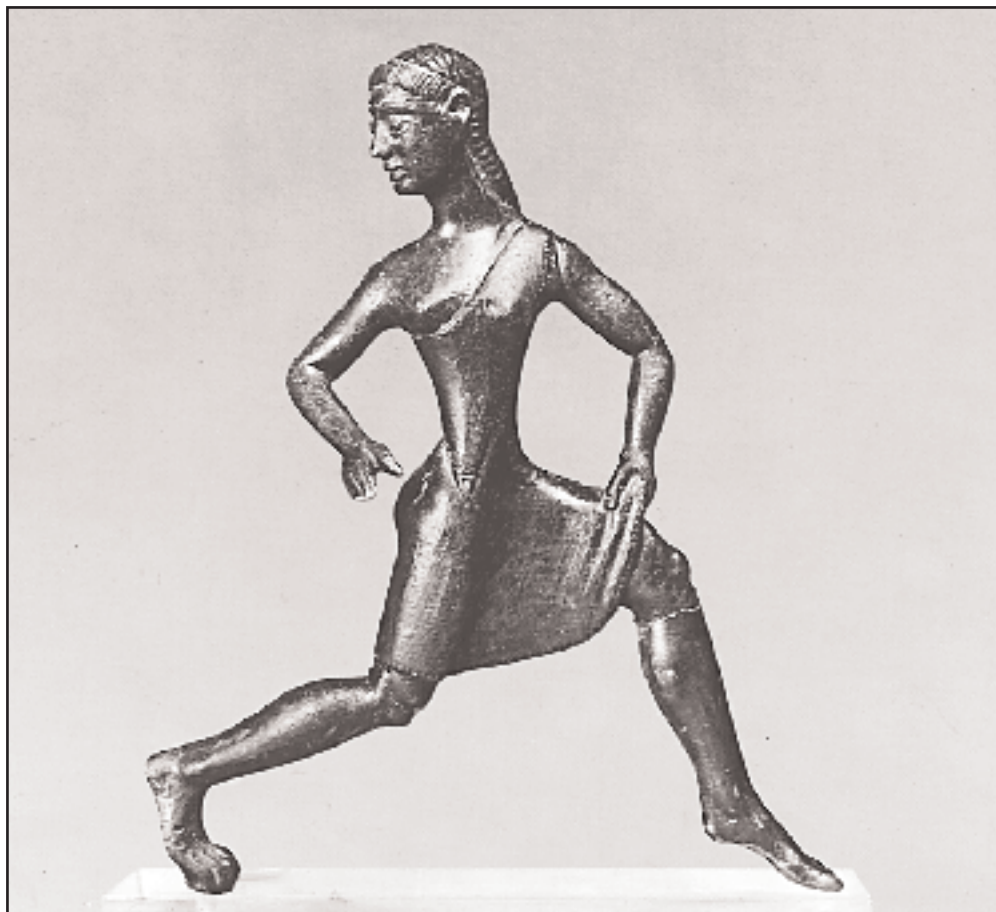
Σπαρτιάτισσα αθλήτρια σε δρόμο ταχύτητας. Χάλκινο αγαλματίδιο, μέσων 6ου αι. π.Χ. Οι αγώνες δρόμου γυναικών προς τιμή της Ηρας, τα Ηραία, γίνονταν στην Ολυμπία έξω από το πλαίσιο των επίσημων Ολυμπιακών Αγώνων και σε άλλη εποχή του χρόνου. (Λονδίνο, Βρετανικό Μουσείο).