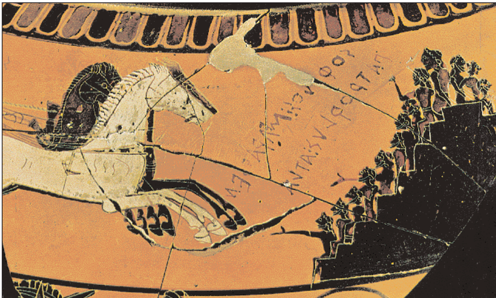
Η σύνδεση των αγώνων με τα ταφικά έθιμα επιβεβαιώνεται και από τη συνήθεια να τιμώνται οι νεκροί ήρωες με επιτάφια αγώνες. Στο θραύσμα αγγείου του Σοφίλου (570 π.Χ.) εικονίζονται οι αγώνες αρματοδρομίας που έγιναν προς τιμήν του Πατρόκλου μπροστά στους συγκεντρωμένους Αχαιοούς. (Αθήνα, Εθνικό Αρχαιολογικό Μουσείο).

Ολυμπία αγώνες αρματοδρομίας με τον τοπικό βασιλιά Οινόμαο. Αλλά και η γυναίκα του Πέλοπα, η Ιπποδάμεια καθιέρωσε αγώνες κοριτσιών, τα Ηραία, προς τιμήν της Ηρας.