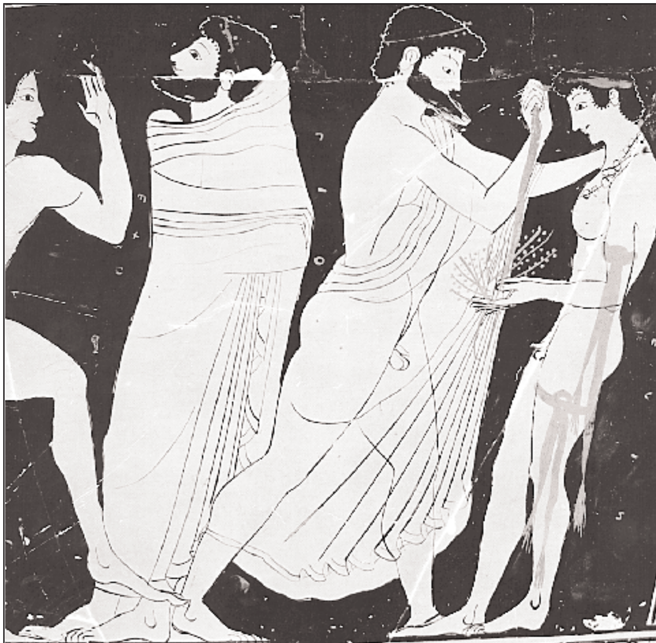
Αγωνοθέτης δένει ταινία γύρω από το κεφάλι νεαρού νικητή που κρατεί στα χέρια του κλαδιά και φύλλα. Παράσταση από αμφορέα αρχών 5ου αι. π.Χ. (Μόναχο, Antikensammlungen).

Η επανακαθιέρωση των Ολυμπιακών αγώνων δεν ήταν μια απλή επανάληψη των παλαιότερων, που είχαν για κάποιο λόγο διακοπεί. Ήταν μάλλον μια ανακαίνιση και συμπλήρωσή τους, τόσο ως προς το πνεύμα, όσο και ως προς το χαρακτήρα τους. Γιατί μετά τον πρώτο χρησμό που έδωσε η Πυθία στον Ιφίτο, ακολούθησε και δεύτερος χρησμός που όριζε το βραβείο της νίκης να μην είναι, όπως παλιά, μηλίτης ή χρηματίτης (ζώα ή άλλα υλικά αγαθά), αλλά στεφανίτης, δηλ. το απέριττο κλαδί της αγριελιάς. Η ευγενέστερη και ιδεαλιστική αυτή αντίληψη των αναδιοργανωμένων αγώνων τότε σηματοδοτεί και την αλλαγή των στόχων τους. Η έννοια του άθλου δεν εξαντλείται πια με την πραγμάτωση του ιδανικού