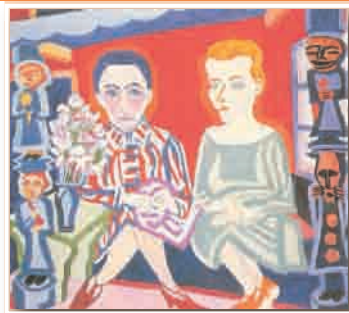
Paul Camenisch , Γυναίκες στη σκιά, 1926, Buendner Kunstmuseum, Chur.

Στο πλαίσιο μιας οργανωμένης πολιτείας, ο άνθρωπος βιώνει μια αδιάκοπη διαδικασία πολιτικής κοινωνικοποίησης. Αυτό σημαίνει ότι μαθαίνει να προσαρμόζεται και να εντάσσεται στην πολιτική πραγματικότητα που τον περιβάλλει. Ο άνθρωπος σταδιακά