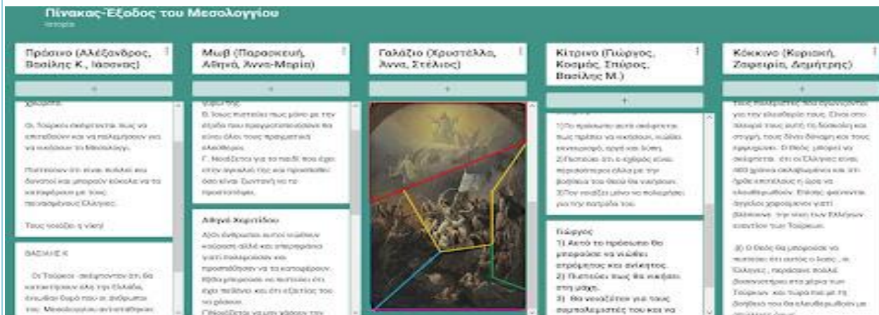
Εικόνα 3 – Έντεχνος συλλογισμός

Αποτελέσματα της δραστηριότητας: Η ανταλλαγή απόψεων σε κλίμα αμοιβαίας αποδοχής και η συλλογική λήψη αποφάσεων εξασφάλισε την αποτελεσματική δημιουργία του ψηφιακού πίνακα.