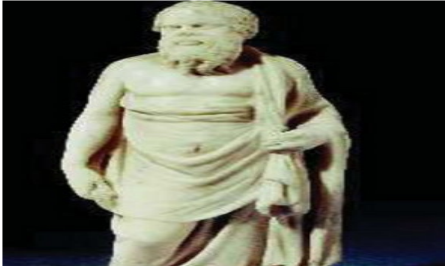
Ο φιλόσοφος Σωκράτης (Λονδίνο, Βρετανικό Μουσείο)