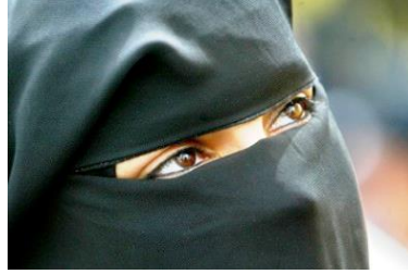
Γυναίκα με μπούρκα