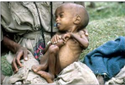
Παιδί από την Αφρική